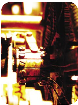
Grammov dinamo stroj, Teslin izazov

Naš su adut ljudi koji s punom odgovornošću, kvalitetno, profesionalno i stručno slijede kompanijske strateške odrednice